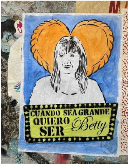
Figura 1. “Cartel homenaje a Betty”

para protestar en contra de la ausencia de participación del Museo por decisión del gobierno de la ciudad (figura 2).