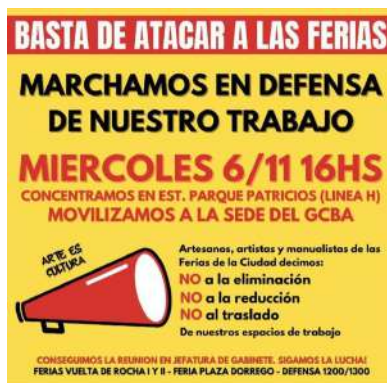
Figura 5. “Marcha Ferias”

Por otro lado, se ha denunciado desde la Asamblea y los vecinos en general con los testimonios que registramos, por ejemplo un entrevistado nos dijo que “desde siempre los domingos había mucha música, tambores, mucha fiesta y personas de muchos lados. Ahora los han estado sacando”. El caso del hostigamiento policial a la comparsa “K’ndombe Amistá” que estaba ensayando en el barrio por la proximidad del Día de los Afrodescendientes. Los forzaron a desplazarse de forma violenta con niños y niñas presentes. De la misma manera, el gobierno de la ciudad tiene planes de reducir los puestos de la feria de los artesanos de la Plaza Dorrego a la mitad con la excusa de cuidar el patrimonio histórico y cultural, así como del espacio público. Sin embargo, esta medida no se aplica a las mesas de los bares y restaurantes que ocupan espacios públicos y son frecuentados por turistas. Frente a estas situaciones, los vecinos y organizaciones se han manifestado (Figura 5 y 6).